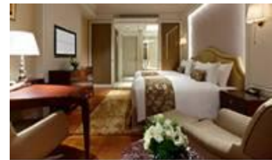
台北大倉久和大飯店圖片