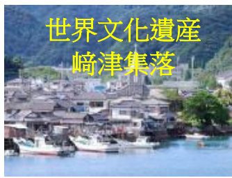
世界文化遺產 崎津集落